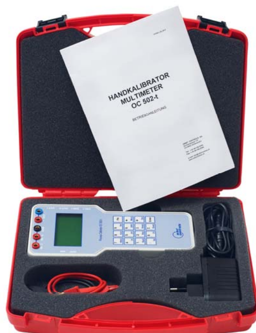
OC 502-t im Koffer mit Zubehör

4mm vergoldete Buchsen für Ein- und Ausgänge.