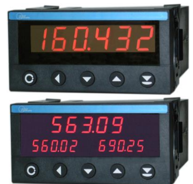
Kontroller und Anzeigen